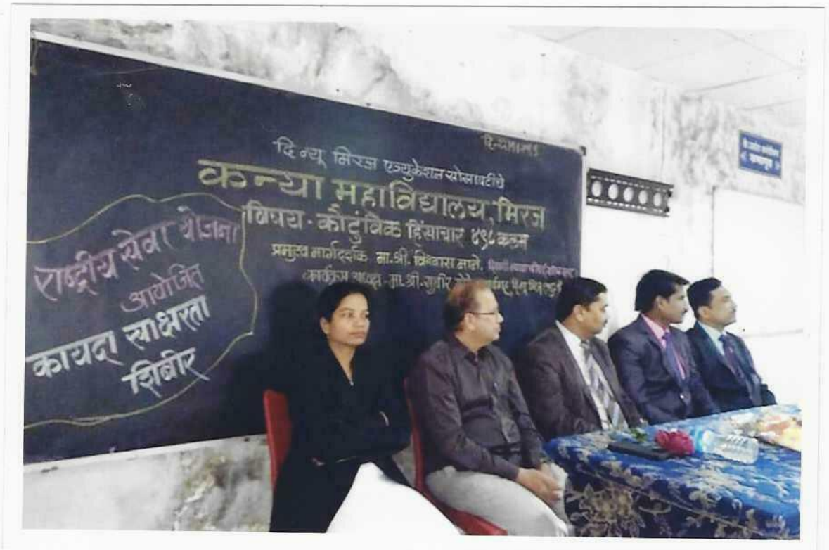
कायदा साक्षरता शिबीर